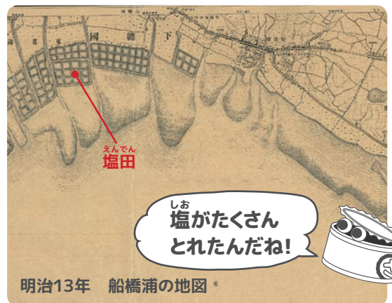
明治13年 船橋浦の地図

しかし、江戸時代中期、東京湾で大地震が起き、その影響で魚がまったくとれなくなりました。すると今まで三番瀬にはこなかった近隣の漁師たちも貝類を求めてここに集まるようになります。この頃から三番瀬をめぐる漁場争いが始まります。この争いは明治になっても続きますが、それだけ三番瀬の海が近隣の漁師にとって貴重な漁場だったということです。